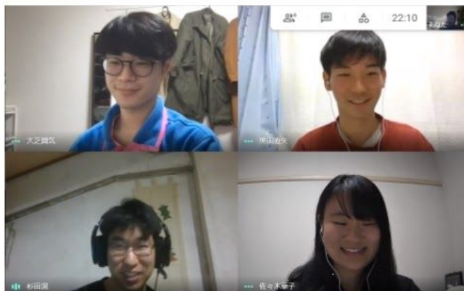
インターンシップ風景